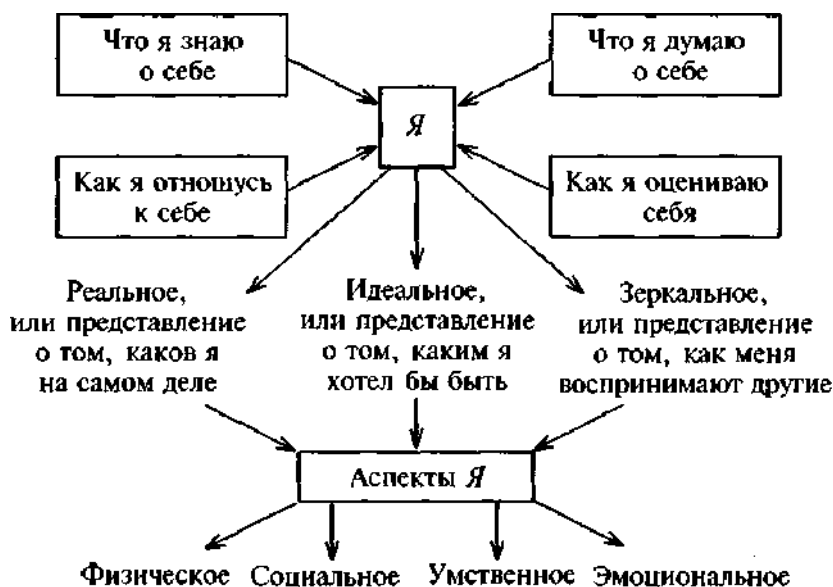
Рис. 2. Структура Я-концепции

Проявленная картина того или иного качества в структуре Я- концепции или Я-концепция в целом подвергается оценке путем сравнения себя с другими людьми или каким-то идеалом (литературный герой, придуманный идеал и др.).