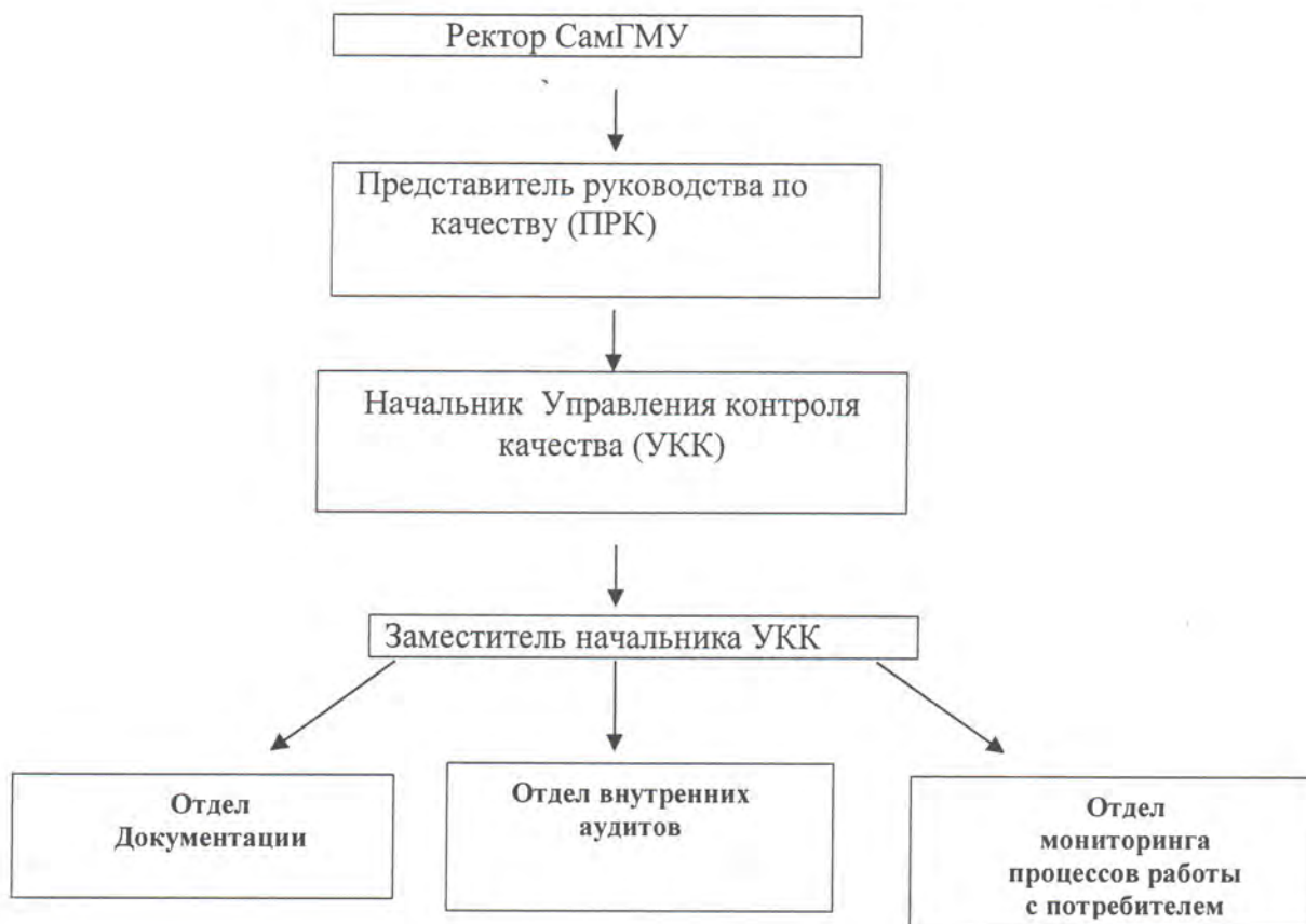
Схема организационной структуры УКК представлена ниже:

Структурная схема УКК и штатное расписание разрабатываются в соответствии с утвержденной структурной схемой управления СамГМУ, согласовываются с отделом кадров (ОК).