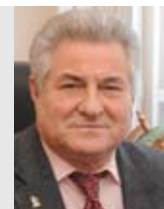
Геннадий Котельников ректор СамГМУ, академик РАН

Руководство Самарского государственного медицинского университета на 2015–2016 годы поставило перед учёными вуза задачу, чтобы новая отрасль экономики – IT-медицина, наряду с аэрокосмической отраслью, химией и автомобилестроением, стала визитной карточкой Самарской области в России и мире. Этому способствует и динамичное развитие кластера медицинских и фармацевтических технологий. Расширяется география присутствия кластера и увеличиваются объёмы сбыта высокотехнологичной продукции на внутреннем и внешнем рынках.