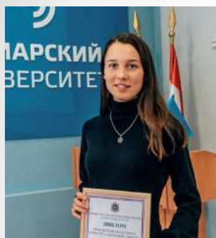
Призовые места молодых ученых на международных, Российских и Региональных конференциях