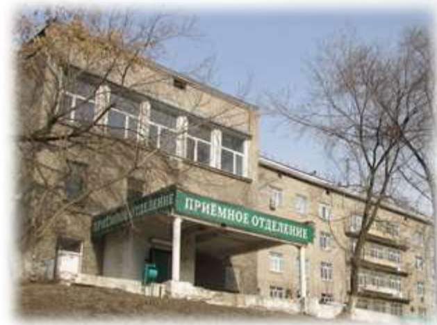
ГБУЗ СО «СГБ № 4»

Все базы соответствуют лицензионным требованиям, технически оснащены по профилю преподаваемой дисциплины.