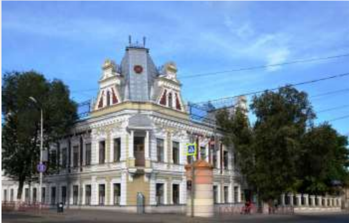
ГБУЗ СОКПТД им. Н.В. Постникова